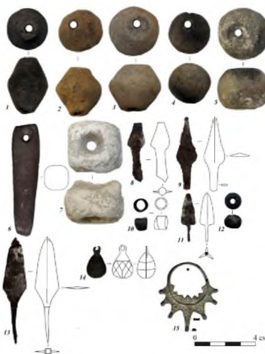
Рис. 2. Находки скифского (1–10), сарматского (11–12) и славянского (13–15) времени.

1–5 – глиняные пряслица; 6 – каменный оселок; 7 – меловое грузило; 8, 9, 11, 13 – железные наконечники стрел; 10 – бронзовая пронизь; 12 – стеклянная бусина; 14 – оловянная пуговица; 15 – височное кольцо.